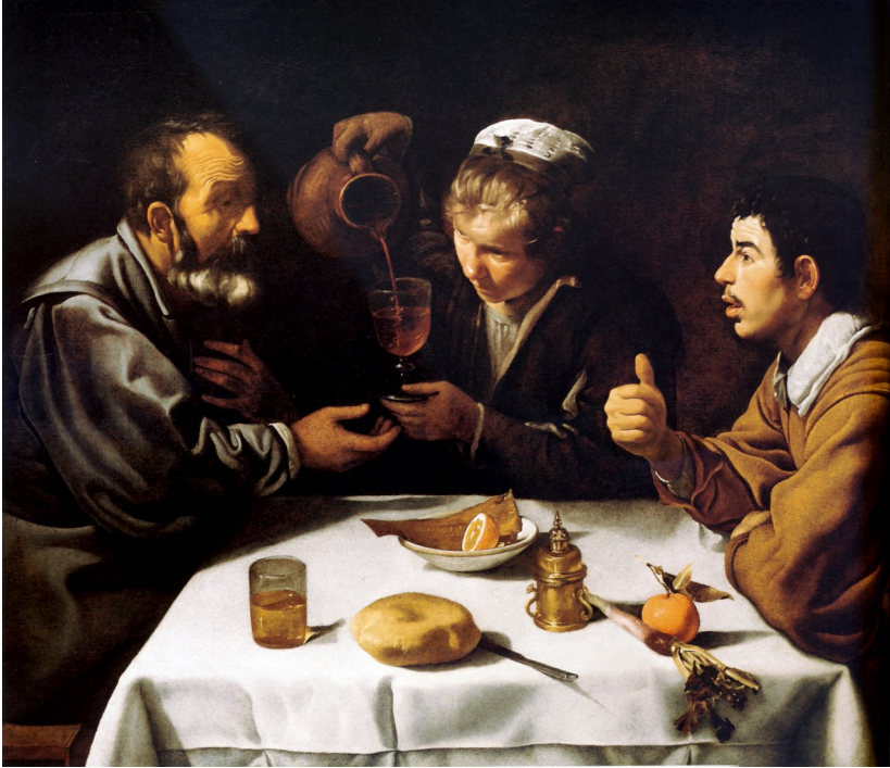
Diego Velázquez - El almuerzo